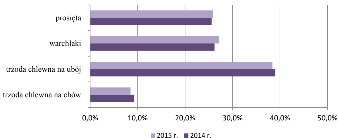
Wykres 2. Struktura pogłowia trzody chlewnej i loch w marcu 2014 r. i 2015 r.

Zmniejszające się pogłowie macior, a co za tym idzie również prosiąt nadal rekompensowane jest dużym importem młodych świń o wadze do 50 kg. Do marca import ten wyniósł 763,9 tys. sztuk i był wyższy niż w analogicznym okresie 2014 r. o 25,9%, a przeciętna waga żywa 1 zaimportowanej sztuki wynosiła 30 kg.