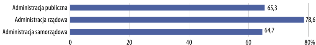
Wykres 2. Jednostki administracji publicznej korzystające z systemu Elektronicznego Zarządzania Dokumentacją (EZD) według rodzaju jednostki w 2018 r.