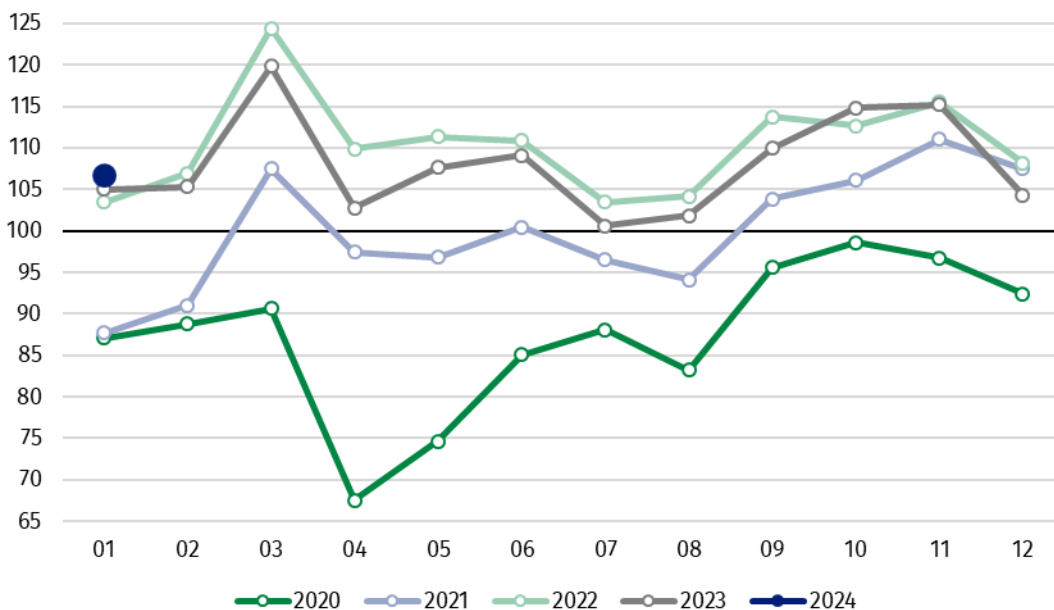
Wykres 1. Produkcja sprzedana przemysłu (przeciętna miesięczna 2021=100)

Spośród głównych grupowań przemysłowych, w styczniu br. odnotowano wzrost w skali roku w produkcji dóbr inwestycyjnych – o 14,4% oraz dóbr konsumpcyjnych nietrwałych – o 2,6%. Zmniejszyła się natomiast produkcja dóbr zaopatrzeniowych – o 4,5%, dóbr związanych z energią – o 1,9% oraz dóbr konsumpcyjnych trwałych – o 1,7%.