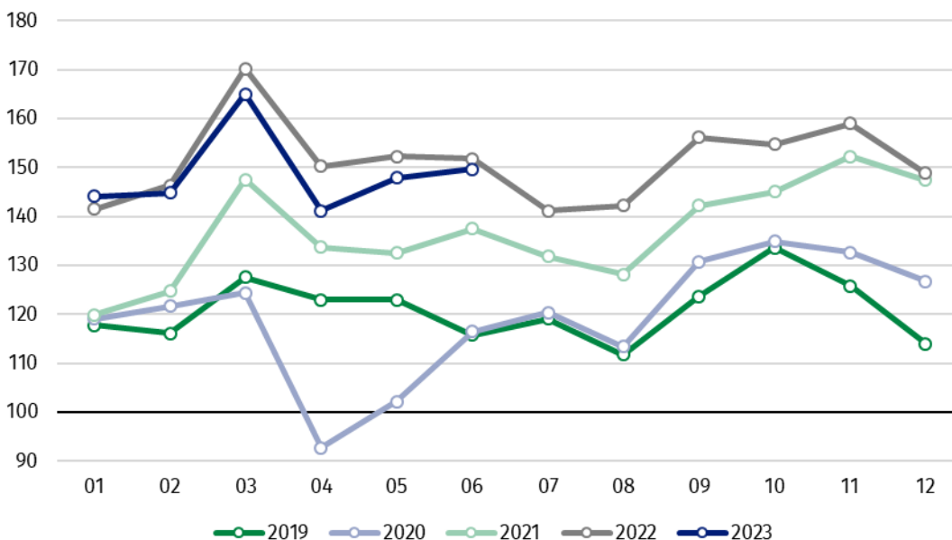
Wykres 1. Produkcja sprzedana przemysłu (przeciętna miesięczna 2015=100)

Spośród głównych grupowań przemysłowych w czerwcu br. odnotowano spadek w skali roku w produkcji dóbr związanych z energią – o 10,9%, dóbr konsumpcyjnych trwałych – o 9,9%, dóbr zaopatrzeniowych – o 5,8% oraz nieznacznie produkcji dóbr konsumpcyjnych nietrwałych – o 0,3%. Zwiększyła się natomiast produkcja dóbr inwestycyjnych – o 11,0%.