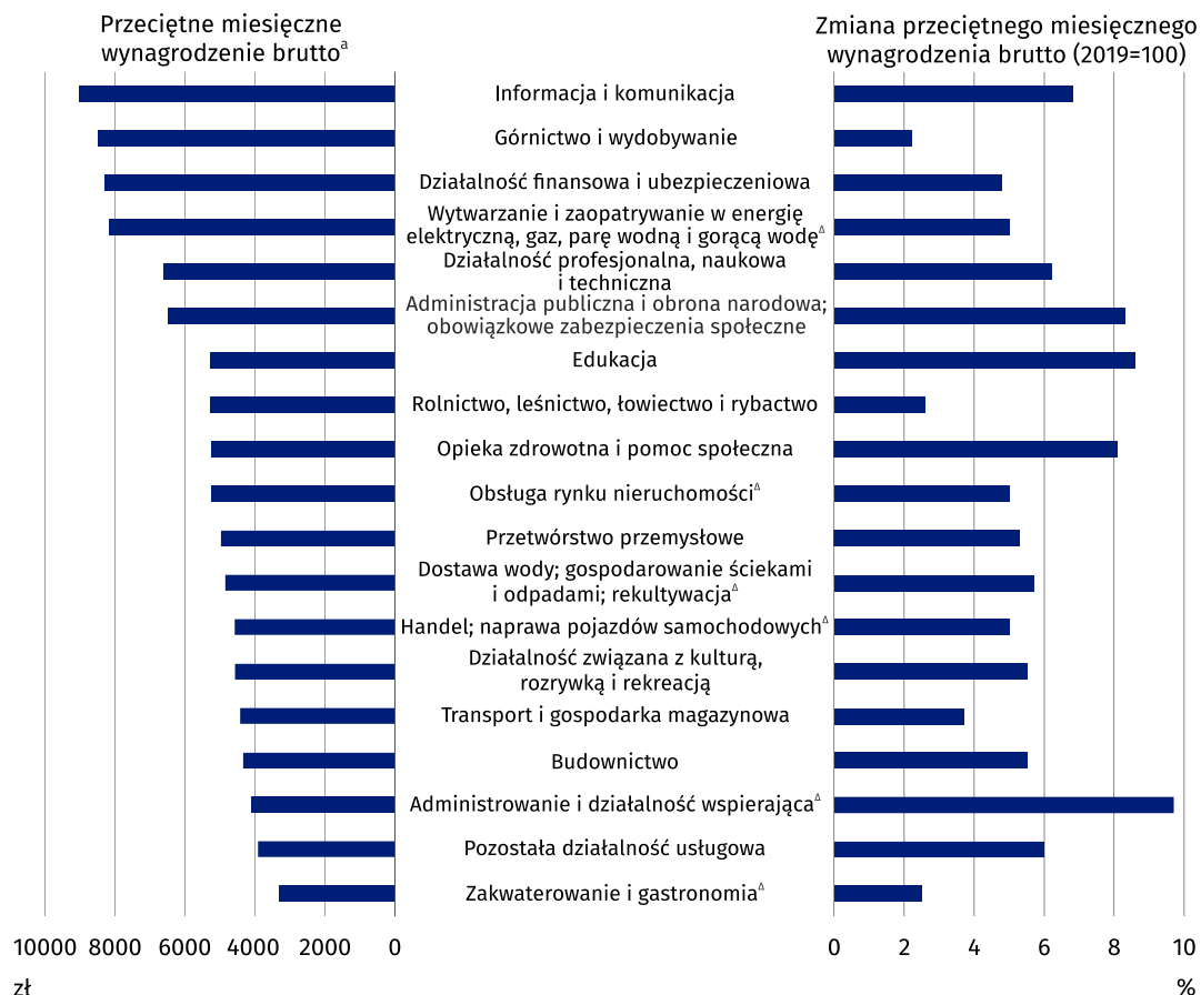
Wykres 3. Przeciętne miesięczne wynagrodzenie brutto w gospodarce narodowej według sekcji PKD w 2020 r. – dane wstępne

a Uszeregowane według wysokości wynagrodzenia.