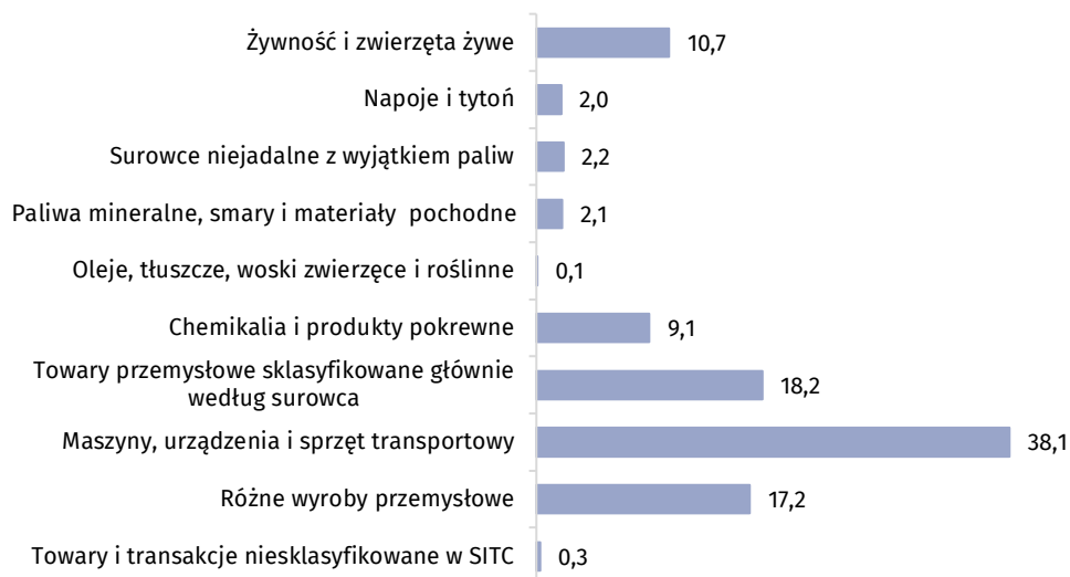
Wykres 2. Struktura importu według sekcji nomenklatury SITC w 2019 r.