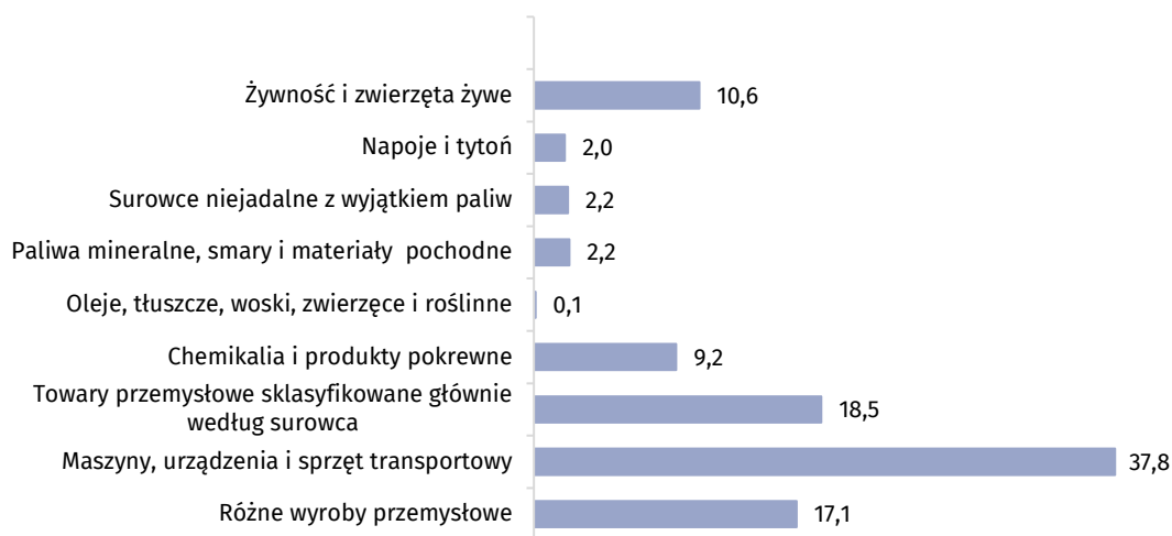
Wykres 2. Struktura importu według sekcji nomenklatury SITC w okresie I - X 2019 r.