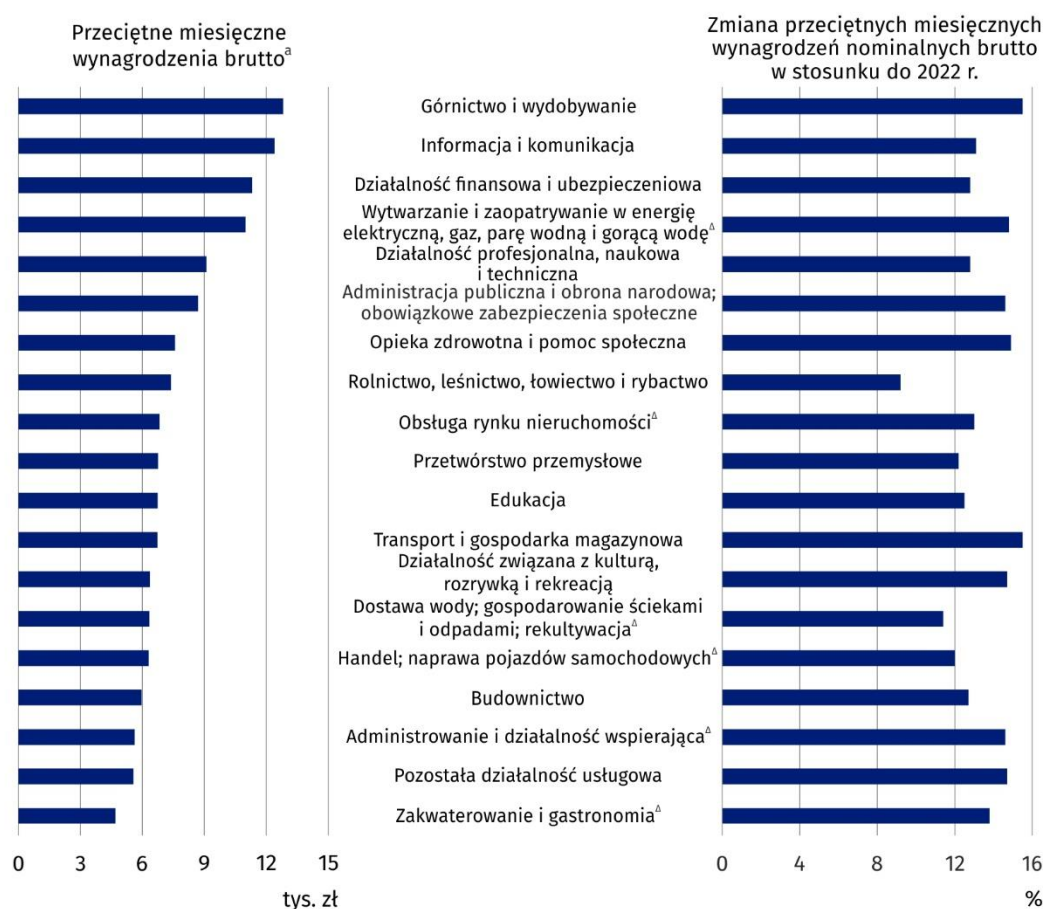
Wykres 2. Przeciętne miesięczne wynagrodzenia brutto w gospodarce narodowej według sekcji PKD w 2023 r. – dane wstępne

a Uszeregowane według wysokości wynagrodzenia.