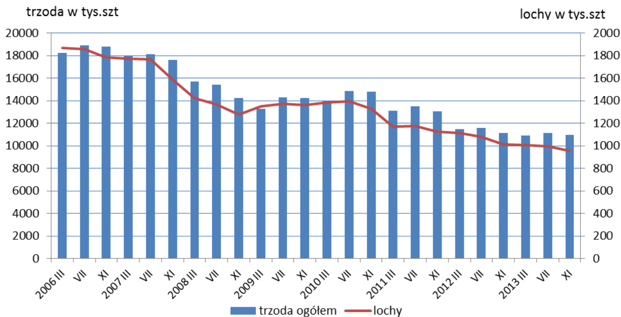
Wykres 1. Pogłowie trzody chlewnej, w tym loch na chów w latach 2006-2013

Stado loch na chów zmniejszyło się w porównaniu z listopadem 2012 r. o 57,0 tys. sztuk (o 5,6 %) do poziomu 955,1 tys. sztuk , w tym pogłowie loch prośnych spadło o 39,3 tys. sztuk (o 5,8%) do 633,6 tys. sztuk . W stosunku do stanu w końcu lipca 2013 r. liczba loch na chów spadła o 42,5 tys. sztuk (o 4,3%), w tym macior prośnych – o 34,6 tys. sztuk, tj. o 5,2 %.