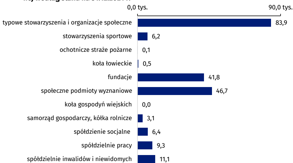
Wykres 2. Liczba osób zatrudnionych na umowę o pracę w podmiotach gospodarki społecznej według stanu na 31.12.2021 r.

Przeciętnie na jeden podmiot zatrudniający przypadają 14 pracowników, z czego najwyższą średnią charakteryzowały się spółdzielnie inwalidów i niewidomych (102 osoby), a następnie spółdzielnie pracy (30 osób) i społeczne podmioty wyznaniowe (29 osób).