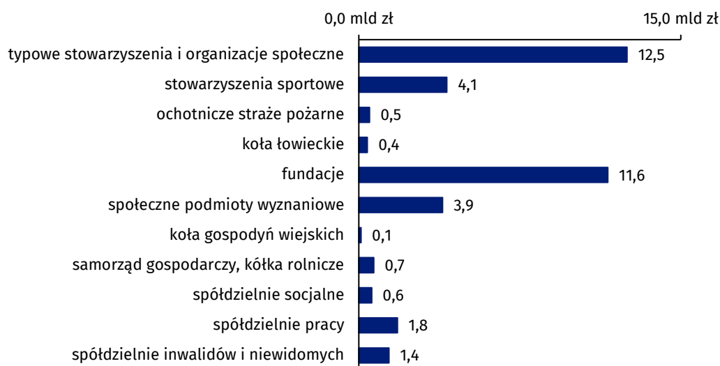
Wykres 5. Koszty podmiotów gospodarki społecznej w 2021 r.

W 2021 r. pożyczkę lub kredyt zaciągnęło 1,5 tys. organizacji non-profit i 0,2 tys. spółdzielni. Łącznie podmioty te stanowiły 1,7% ogółu badanej zbiorowości. Całkowita wartość zaciągniętych pożyczek i kredytów wyniosła 395,1 mln zł, z czego 2/3 stanowiły zobowiązania typowych stowarzyszeń i organizacji społecznych oraz fundacji. Spółdzielnie zaciągnęły pożyczki lub kredyty na łączną sumę 63,0 mln zł, co stanowiło 15,9% ogólnej wartości zobowiązań przyjętych przez podmioty gospodarki społecznej. Średnia wartość pożyczek i kredytów zaciągniętych przez organizacje non-profit wyniosła 217,1 tys. zł, a przeciętna wartość zobowiązań podjętych przez spółdzielnie sięgnęła kwoty 372,8 tys. zł. Najwyższą średnią odnotowano w spółdzielniach inwalidów i niewidomych (1 157,8 tys. zł), następnie wśród społecznych podmiotów wyznaniowych (979,1 tys. zł). W dwóch rodzajach organizacji non-profit – kołach łowieckich i kołach gospodyń wiejskich zaciąganie kredytów niemal nie występowało.