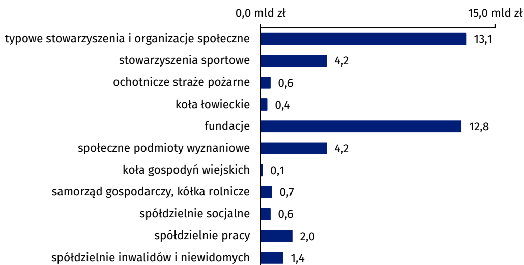
Wykres 4. Przychody podmiotów gospodarki społecznej w 2021 r.

Wśród spółdzielni odnotowano zdecydowanie wyższe wartości przeciętnych przychodów niż wśród organizacji non-profit (3 121,2 tys. zł wobec 415,6 tys. zł). Szczególnie wysokie średnie wartości przychodów wystąpiły w spółdzielniach inwalidów i niewidomych (13 248,9 tys. zł) oraz w spółdzielniach pracy (6 211,3 tys. zł). Organizacje non-profit charakteryzowały się znacznym zróżnicowaniem finansowym. Porównując średnią wartość przychodów, najwyższy wskaźnik osiągnęły społeczne podmioty wyznaniowe – 2 192,9 tys. zł, a najniższą średnią wartość przychodów odnotowano wśród kół gospodyń wiejskich (10,1 tys. zł), a następnie w ochotniczych strażach pożarnych (45,0 tys. zł).