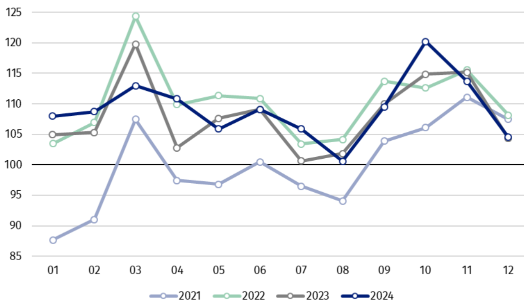
Wykres 1. Produkcja sprzedana przemysłu (przeciętna miesięczna 2021=100)

Spośród głównych grupowań przemysłowych, w grudniu 2024 r. odnotowano wzrost w skali roku w produkcji dóbr konsumpcyjnych nietrwałych – o 5,5%, dóbr związanych z energią – o 1,7%, dóbr konsumpcyjnych trwałych – o 0,8% oraz dóbr zaopatrzeniowych – o 0,4%. Zmniejszyła się natomiast produkcja dóbr inwestycyjnych – o 6,7%.