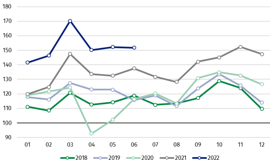
Wykres 1. Produkcja sprzedana przemysłu (przeciętna miesięczna 2015=100)

W większości głównych grupowań przemysłowych w czerwcu br. odnotowano wzrost produkcji w skali roku. Produkcja dóbr inwestycyjnych zwiększyła się o 18,4%, dóbr związanych z energią – o 15,1%, dóbr konsumpcyjnych nietrwałych – o 11,4% oraz dóbr zaopatrzeniowych – o 7,3%. Zmniejszyła się natomiast produkcja dóbr konsumpcyjnych trwałych – o 7,9%.