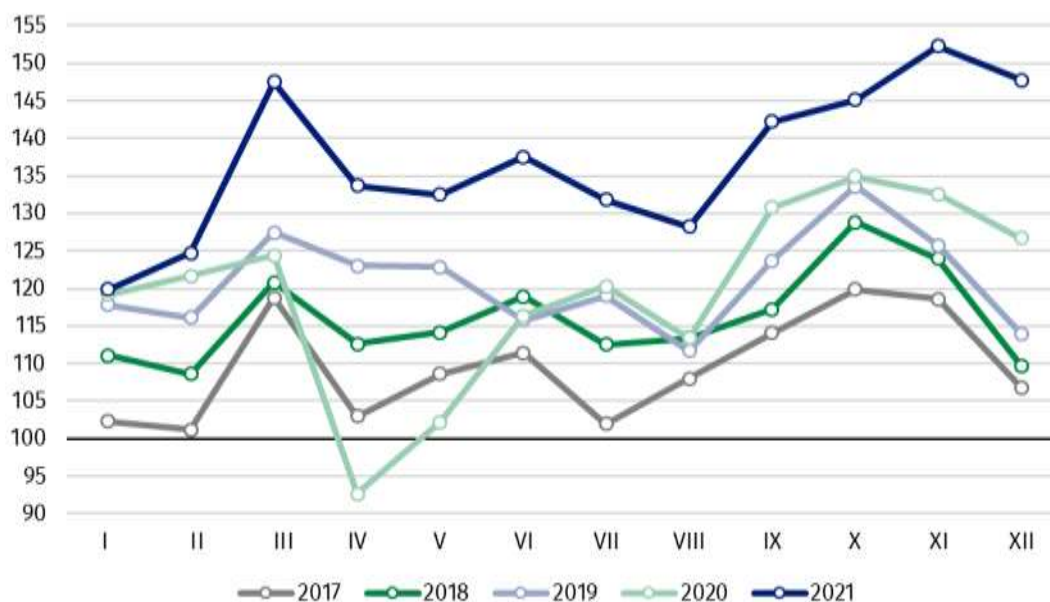
Wykres 1. Produkcja sprzedana przemysłu (przeciętna miesięczna 2015=100)

We wszystkich głównych grupowaniach przemysłowych w grudniu 2021 r. odnotowano wzrost produkcji w skali roku. Najbardziej zwiększyła się produkcja dóbr związanych z energią – o 39,4%. W mniejszym stopniu zwiększyła się produkcja dóbr zaopatrzeniowych – o 17,6%, dóbr inwestycyjnych – o 12,6%, dóbr konsumpcyjnych nietrwałych – o 7,7% oraz dóbr konsumpcyjnych trwałych – o 7,2%.