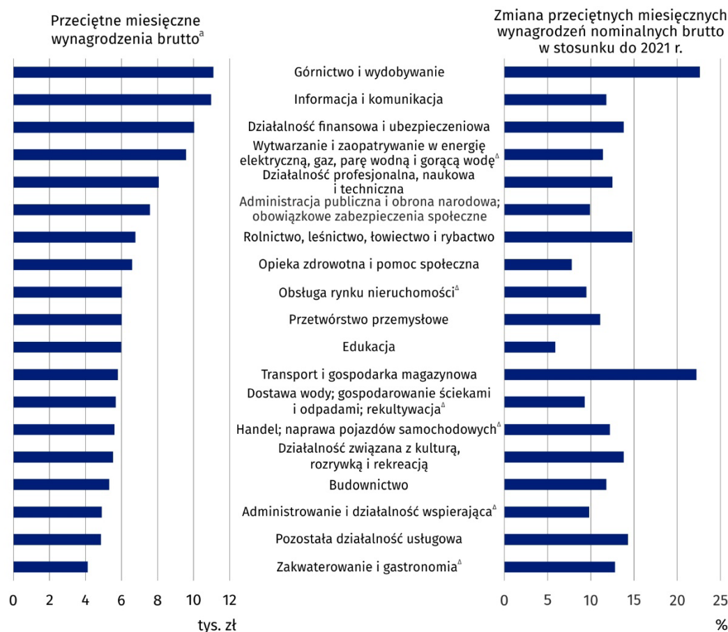
Wykres 2. Przeciętne miesięczne wynagrodzenia brutto w gospodarce narodowej według sekcji PKD w 2022 r. – dane wstępne

a Uszeregowane według wysokości wynagrodzenia.