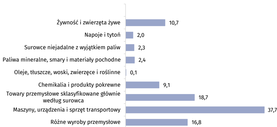
Wykres 2. Struktura importu według sekcji nomenklatury SITC w okresie I - VIII 2019 r.