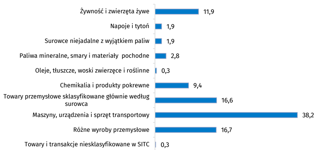
Wykres 2. Struktura importu według sekcji nomenklatury SITC w styczniu - kwietniu 2024 r.