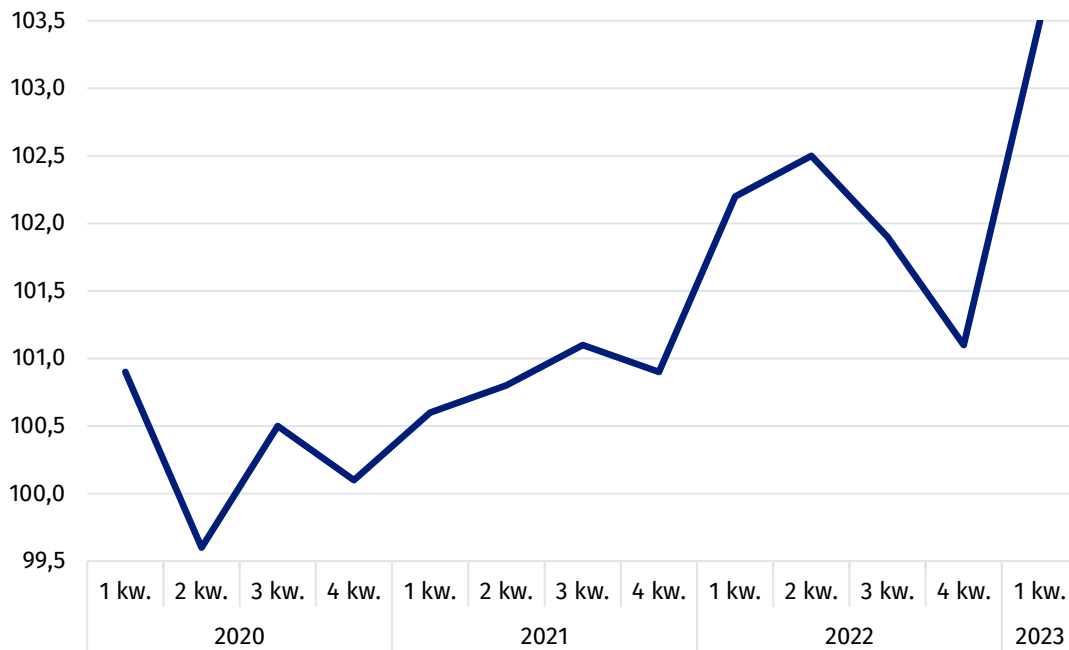
Wykres 2. Zmiany cen producentów usług związanych z obsługą działalności gospodarczej w latach 2020-2023 (analogiczny okres roku poprzedniego = 100)