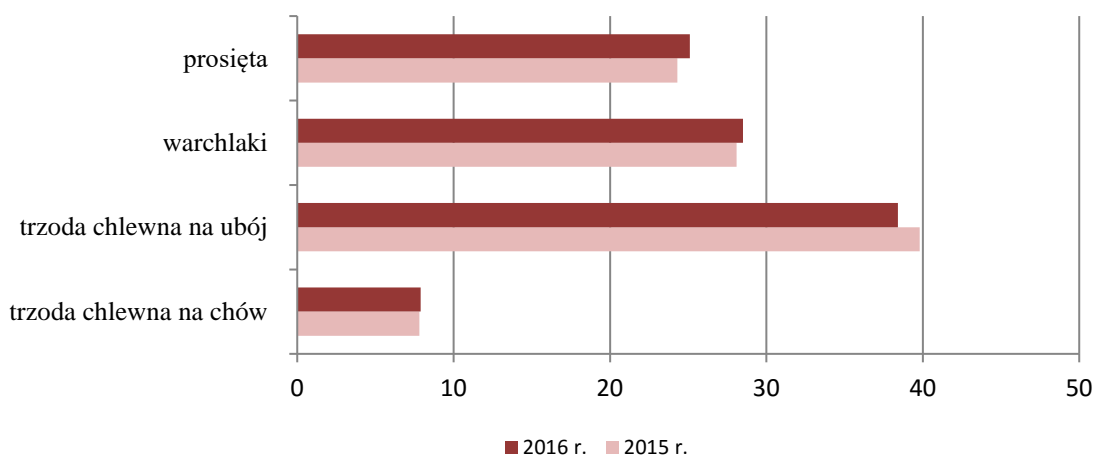
Wykres 2. Struktura pogłowia trzody chlewnej i loch w grudniu 2015 r. i 2016 r.

Nadal utrzymuje się duży import młodych świń o wadze do 50 kg. Do grudnia import ten wyniósł 4880,9 tys. sztuk i był wyższy niż w analogicznym okresie 2015 r. o 5,2%, a przeciętna waga żywa 1 zaimportowanej sztuki wynosiła 30,1 kg. Dodatkowo w tym okresie wystąpił trzykrotny wzrost importu świń hodowlanych.