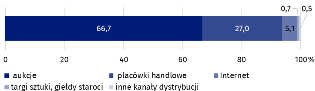
Wykres 2. Struktura sprzedaży dzieł sztuki i antyków według kanałów dystrybucji w 2022 r.

Dwie trzecie (66,7%) wartości sprzedaży dzieł sztuki i antyków uzyskano poprzez aukcje