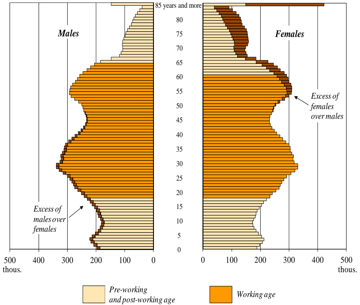
The Population Age Pyramid (as of June 30, 2012)