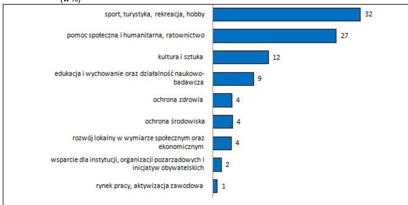
Wykres 2. Badane organizacje trzeciego sektora aktywne w 2010 r. według wybranej dziedziny działalności statutowej określonej za pomocą pierwszego, najważniejszego pola działalności (w %)

W ramach swojej działalności statutowej 1 w 2010 r. badane organizacje najczęściej prowadziły działania w dziedzinach: sport, turystyka, rekreacja, hobby (32%); pomoc społeczna i humanitarna, ratownictwo (27%), kultura i sztuka (12%).