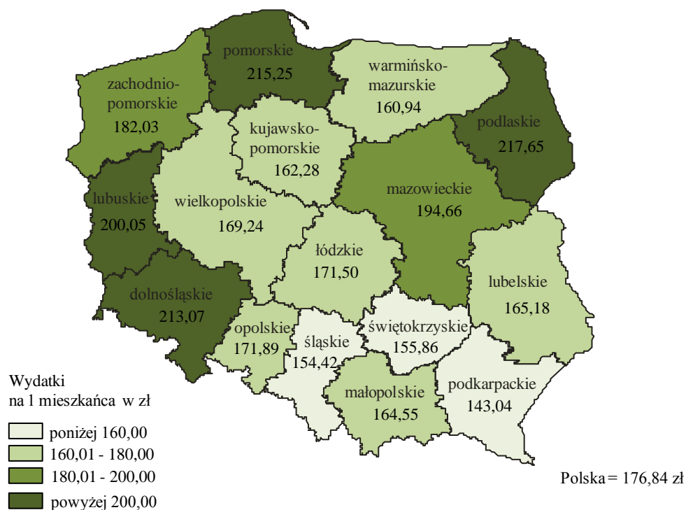
Wykres 2. Wydatki jednostek samorządu terytorialnego na kulturę i ochronę dziedzictwa narodowego na 1 mieszkańca według województw a w 2011 r.

a Łącznie z transferami pomiędzy jednostkami samorządu terytorialnego.